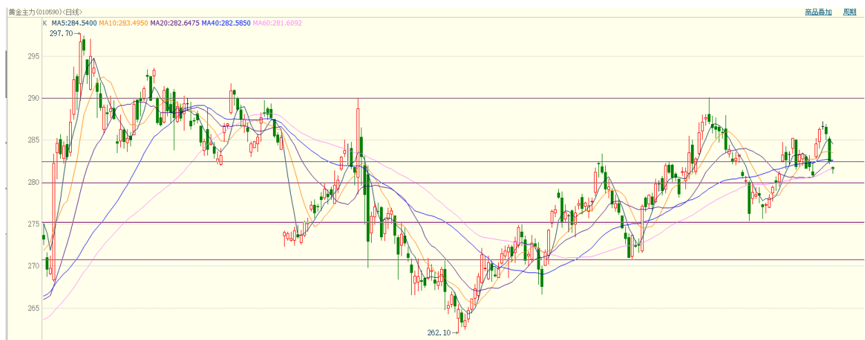
图 9：国内黄金期货走势图