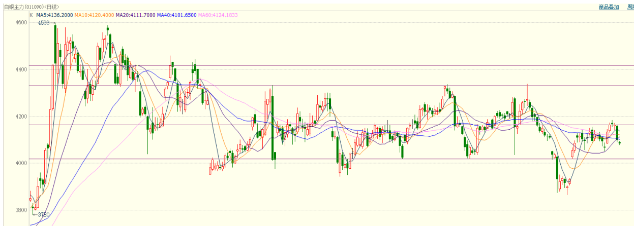
图 11：国内期货白银走势图