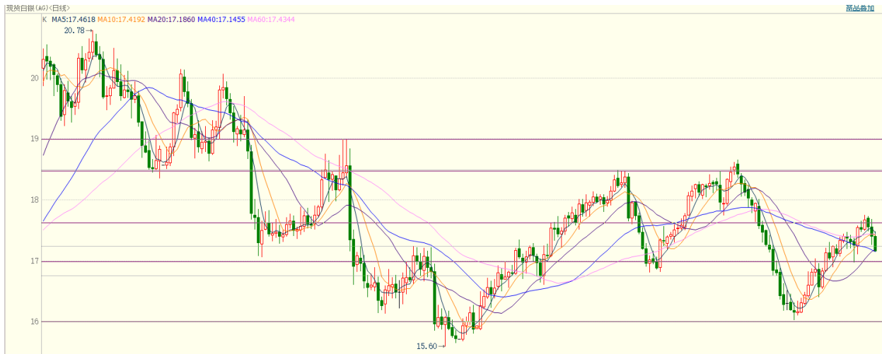
图 10：现货白银走势图

本周，国际现货黄金反弹至前高处遇阻回调，下方支撑 1258 美元，1225 美元，压力位仍然看 1300 美元；国内黄金期货 1712 合约走势跟随国际现货黄金，下方支撑 280 元、278 元。