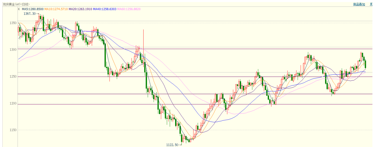
图 8：现货黄金走势图