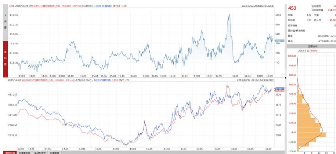
螺纹钢基差走势图

总之，当前现货市场供需面及基差结构支持期价上涨，预计短期仍有反弹空间。但考虑需求淡季临近，刚性需求减少预期，市场偏空气氛逐渐加强，期价大幅反弹概率较小，预测中期价格或将呈区间震荡格局。后期重点关注库存变化和贸易商冬储意愿情况，及时对市场做出判断。