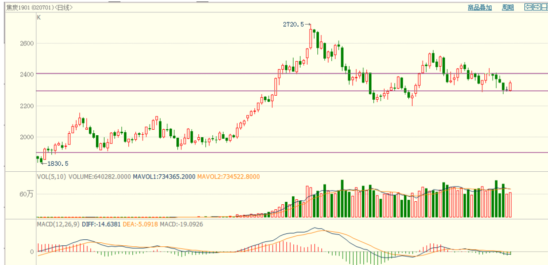
图 1: 焦炭 1901 合约日线图

近期焦炭基本面仍向好,钢厂需求延续旺盛,加之焦炭供应偏紧,对市场有支撑。焦炭J1901 合约短期大幅下跌概率较小,下方支撑2200-2300 之间,压力 2400,操作上,可采用区间内高抛低吸策略。