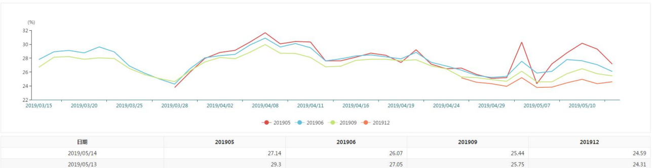
图 5 隐含波动率期限结构