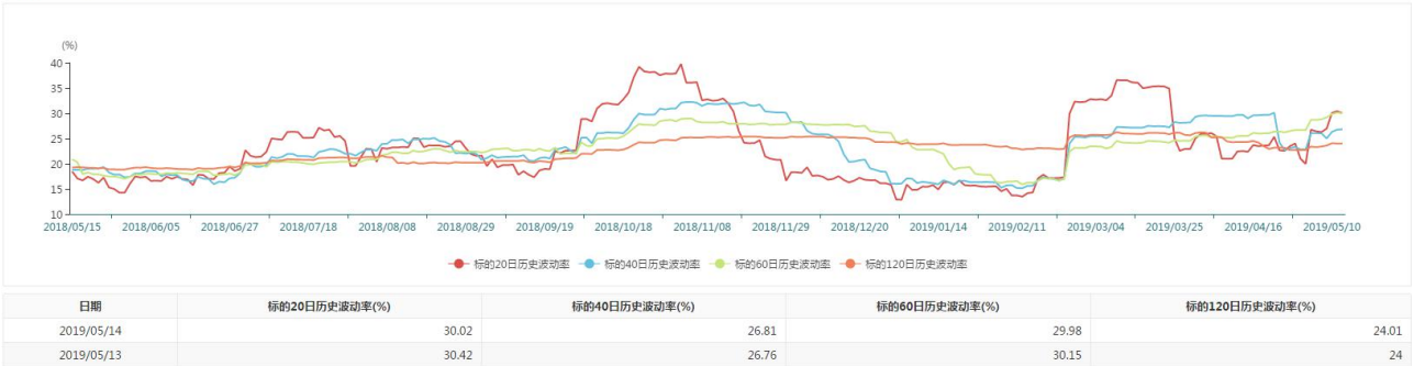
图 4 历史波动率