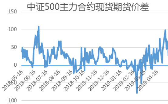
中证 500 主力合约基差