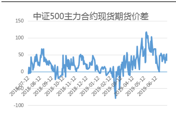
中证 500 主力合约基差