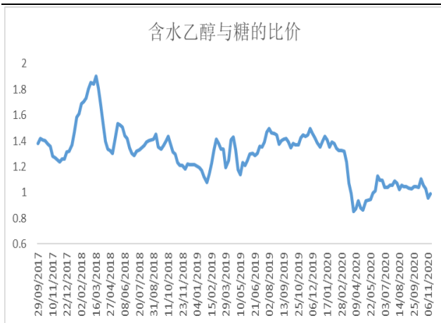
图表 2: 醇糖比价