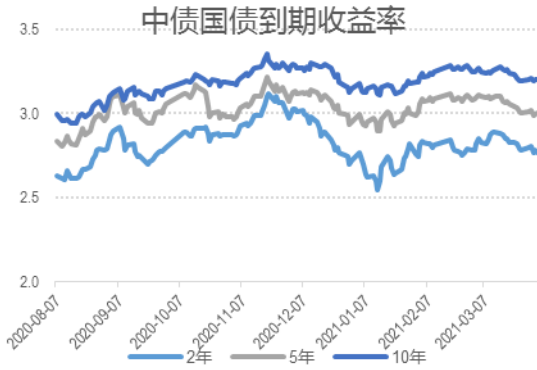
图表 4: 中债国债到期收益率